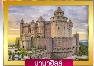
บานาฮิลล์