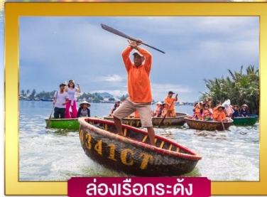
ล่องเรือกระดัง