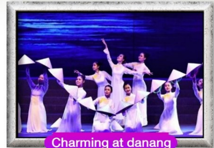
Charming at danang