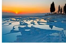
ปามุคคาเล่

** พักที่ RICHMOND THERMAL HOTEL 5* หรือเทียบเท่า **