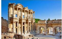
เมืองโบราณเอเฟซุส