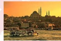
ถ่องเรือช่องแคบบอสฟอรัส