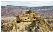
นครไต้ดิน