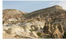
หุบเขาเดเฟเรนท์