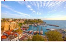
อันตาเลีย