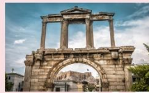
ชุ่มประตุเฮเดรียน

** พักที่ B BUSINESS HTOEL 5* หรือเทียบเท่า **