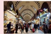
ตลาดสไปซ์มาร์เกต

** พักที่ TAKSIM GONEN HOTEL 4* หรือเทียบเท่า **