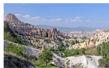
หมู่บ้านของนกพิราบ

** พักที่ DEDELI CAVE HOTEL 5* หรือเทียบเท่า **