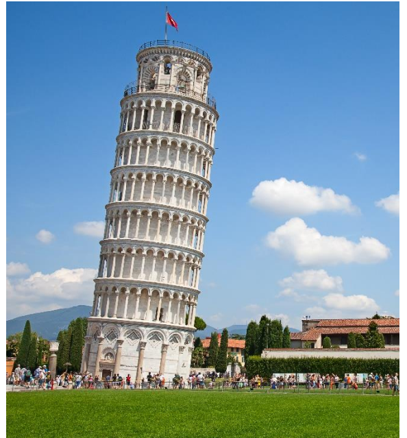
Highlight ! หอเอนปิซ่าเคยเป็นสถานที่กาลิเลโอมาพิสูจน์เรื่องแรงโน้มถ่วงของโลกและการตกของวัตถุ

นำท่านเก็บภาพความประทับใจและถ่ายรูป 1 ใน 7 สิ่งมหัศจรรย์ของโลก หอเอนปิซ่า (Leaning Tower of Pisa) หอเอนปิซ่าที่สร้างขึ้นเพื่อเป็นหอระฆังแห่งวิหารประจำเมือง แต่เพียงการเริ่มต้นของการสร้างถึงบริเวณชั้น 3 ก็เกิดการทรุดตัวและต้องหยุดการก่อสร้างจนถัดมาอีก 100 ปี ถึงได้สร้างต่อจนเสร็จสมบูรณ์ มหาวิหารปิซ่า (Cathedral of Pisa) มหาวิหารที่สวยงามที่สุดในลักษณะโรมันเนสส์ แสดงให้เห็นจากซ้ายหอศิลป์ ล้อมกลางตัวมหาวิหาร และขวาหอระฆัง ตัวมหาวิหารเป็นผังกางเขน มีมุขท้ายวัด และตกแต่งซุ้มโค้งรอบวัดภายนอกเป็นแบบแถบหินอ่อน สลับสีทางขวาง ซึ่งกลายมาเป็นแบบที่เรียกว่า "ลักษณะปิซ่า" และโดมรูปไข่ และ Pisa Baptisty of St. John เป็นอาคารทางศาสนาคริสต์นิกายโรมันคาทอลิก