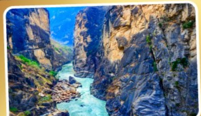
ช่องแคบเสื่อกระเจิง

เมนูพิเศษ ! สุกี่ปลาเซลมอน สุกี่เห็ด อาหารกวางตุ้ง