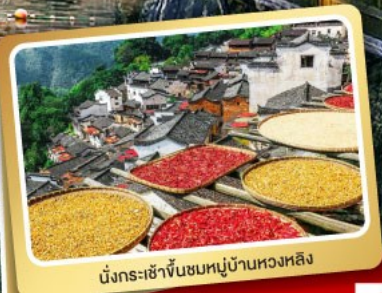
นั่งกระเช้าขึ้นชมหมู่บ้านหวงหลิง