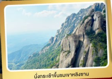
นั่งกระเช้าขึ้นชมเขาหลงซาน