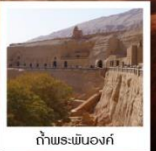
กำแพงพันงค้