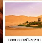
ทะเลทรายหนิงชางฮาน