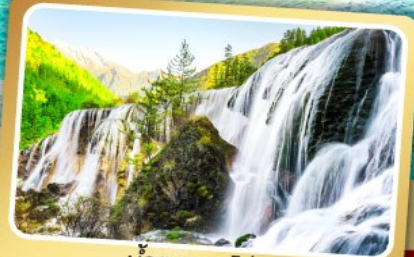
น้ำตกธารโง่บู่

ชมโชว์เปลี่ยนหน้ากาก แบบพิเศษ สุกี้หมาล่าเสฉวน