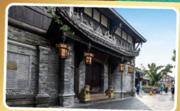
ถนนควานโจเซียงจื่อ