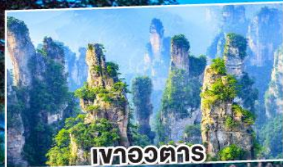
เวาอวตาร