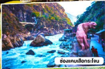
ช่องแคบเลียงโง