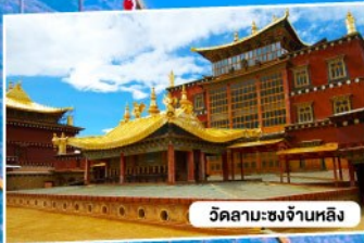
วัดลามะซงจ้านหลิง

แซงกรี่ล่า โดยรถไฟความเร็วสูง (ไม่ลงร้าน) 6 วัน 5 คืน