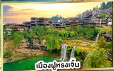
เมืองฝูหลงเจิน