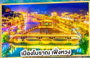
เมืองโบราณ เฟิ่งหวง