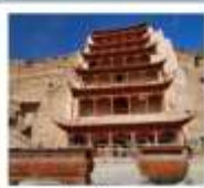
กำแพงมอเก