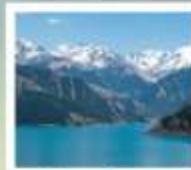
เขียวเซาเทียนซาน

ห้องเรือร้อนเจ็ดเศียร / 5ดั่งหงษ์เรือ / ป่าหินแม่น้ำหวงเหอ / กามยนต์ 3 มิติ ระบบคอมพิวเตอร์คู่หูฟาน / กำแพงมอเก / อุทยานจางเย่ต้นเคียวดีใจกวงหยวน กำแพงเมืองด่านเจ็ดคิ้ว / เข็มทรายหงษ์สาม / สระน้ำวงพระจันทร์ / กำแพงมอเก หมู่บ้านอุหลู่ / เมืองโบราณเทาทง / เขียวเซาเทียนซาน / ส่องเรือทะเลสาบเทียนฉือ