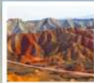
ทะเลสาบสูง