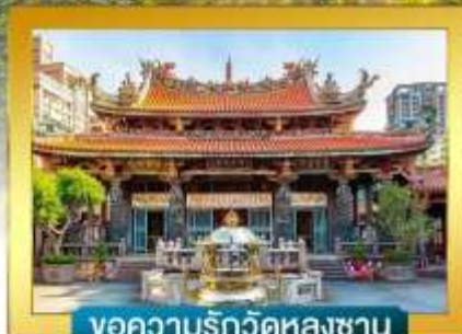
ขอความรักวัดหลงซาน