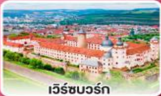
เวิร์ชบวร์ค