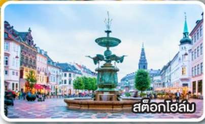
สต็อกโฮล์ม