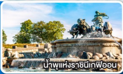
น้ำพุแห่งราชินีเฟอออน