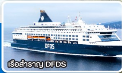
เรือสำราญ DFDS