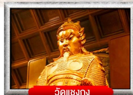
วัดแชงกง