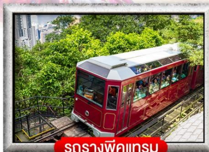
รถรางพิกแทรม