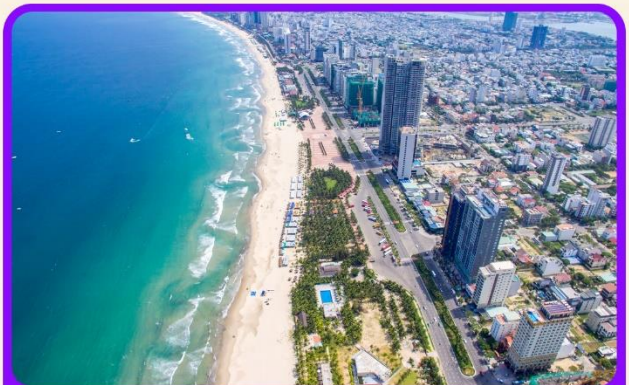
เซ็ควิน ชายหาดหมีคว เป็นชายหาดที่สวยงามที่สุดในเมืองดานัง