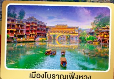
เมืองโบราณเฟิงหวง