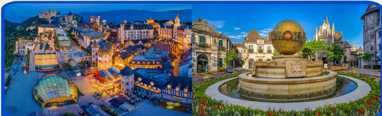
พักผ่อน บานฮิแยล 1 คืน