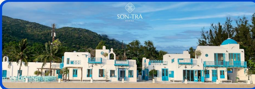
เซ็คอินคาเฟ่ SON TRA MARINA