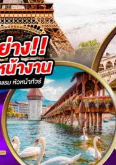
สะพานไม้ ชาเปล