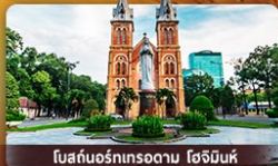
โบสถ์นอร์ทเทรอดาม โฮจิมินห์