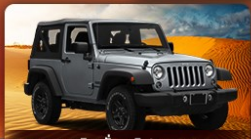
OPTION เสริม นั่งรถจี๊ปทะเลทราย