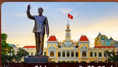
ชมอนุสาวรีย์ท่านประธานาธิบดีโฮจิมินห์

ส่งเรือรับประทานอาหารแม่น้ำโขง นั่งรถJEEP ทะลุทะเลทรายขาว ทะเลทรายแดง มุยเน่ “แกรนด์แคนยอนแห่งเวียดนาม” ลำธาร FAIRY STREAM นครโฮจิมินห์ เมืองที่มีขนาดใหญ่ที่สุดของประเทศเวียดนาม โบสถ์นอร์ทเทรอดาม ไปรษณีย์กลาง ถนน Nguyen Hue อนุสาวรีย์ท่านประธานาธิบดีโฮจิมินห์ ซอยบิงตลาดเบนกัน อุโมงค์กู๋จี