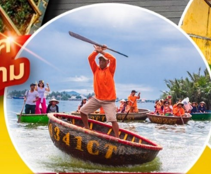
นั่งเรือกระด้ง Hoi an