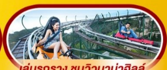
เล่นรถราง ชมวิวบานาฮิลล์