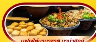
บุฟเฟ่ต์นานาชาติ บานาฮิลล์

นั่งกระเช้าที่ยาวที่สุดในโลก ขึ้นสู่บานาฮิลล์ ชมเมือง ฮอยอัน เมืองมรดกโลกที่สวยงามและเจียบสงบ พิเศษ!! บุฟเฟ่ต์นานาชาติ บานาฮิลล์