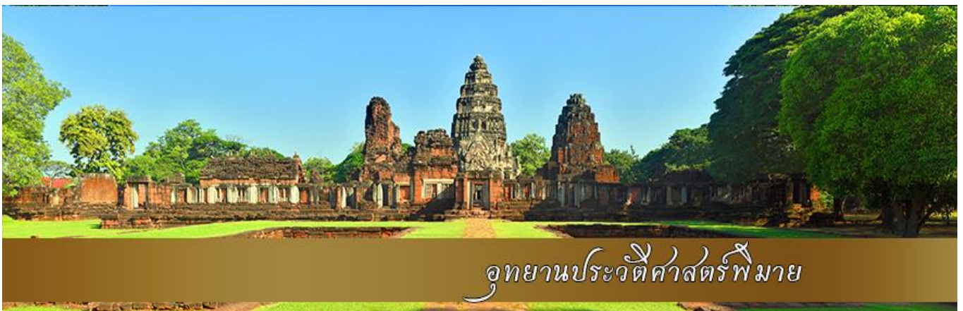
อุทยานประวัติศาสตร์พิมาย

เที่ยง รับประทานอาหารกลางวัน ณ ร้านอาหารท้องถิ่น