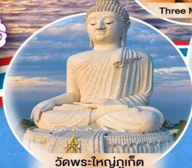
วัดพระใหญ่ภูเก็ต