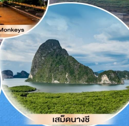
เสม็ดนางชี