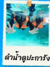
ดำน้ำดูปะการัง