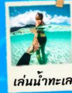
เล่นน้ำทะเล