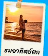
ชมอาทิตย์ตก