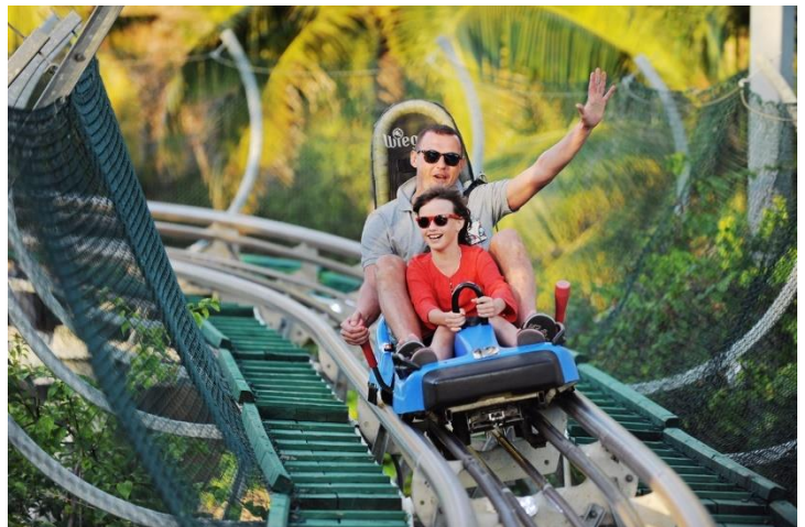
นักท่องเที่ยว

ค่าที่พัก รับประทานอาหารเย็น ณ ภัตตาคารพื้นเมือง อาหารบุฟเฟต์ บนบานาฮิลล์ (2) โรงแรม Mercure French Village Bana Hills ระดับ 4 ดาว หรือเทียบเท่า