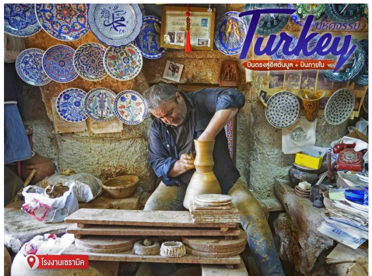
โรงงานเซรามิค