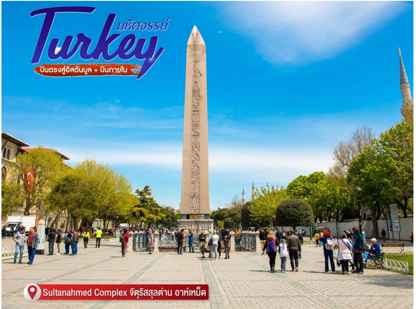
Sultanahmed Complex จตุรัสสุลต่าน อาห์เหม็ด

ในปี พ.ศ. 1483 แต่เดิมเป็นเสาบรอนซ์ แต่ในช่วงสงครามครูเสดได้ถูกศัตรูหลอมเอาบรอนซ์ออกไปจนเหลือเพียงแค่เสาปูนเท่านั้น