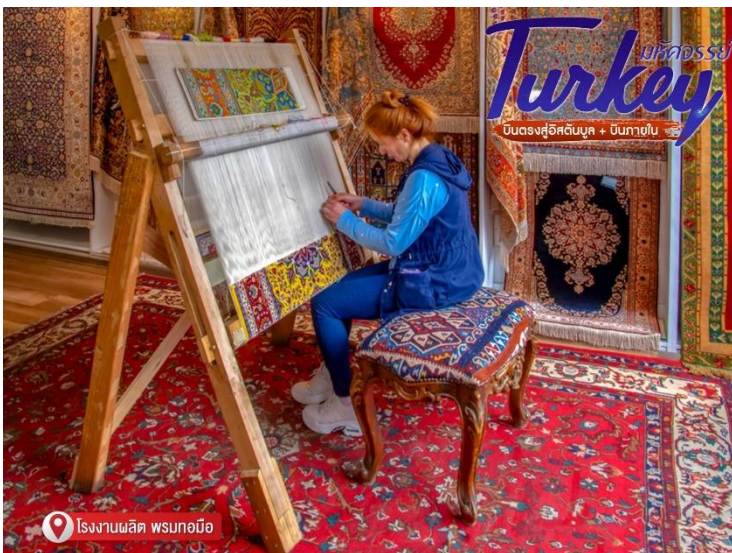
โรงงานผลิต พรมทอมือ

ชมโรงงานผลิต พรมทอมือ หัตถกรรมของชาวตุรกีที่มีชื่อเสียงโด่งดังไปทั่วโลก มีคุณภาพดี ลวดลายสวยงาม และมีราคาแพง หาซื้อได้ทั่วไป ลวดลายแตกต่างกันออกไปตามแหล่งที่ผลิต แต่ละท้องถิ่นจะมีสินค้าขึ้นชื่อของตนเองโดยเฉพาะ พรมที่มีราคาแพงจะทอด้วยขนสัตว์ มีชื่อเสียงมากที่สุดต้องเป็นของเมืองเฮเรเค (Hereke)พรมมี 2 แบบ ตามลักษณะความยาวของเส้นใบที่ใช้ทอคือ ฮาลี (Hali) เป็นพรมทั่วไปที่นิยมขายกันอย่างแพร่หลาย ทำจากวัสดุ ทั้งขนสัตว์ ฝ้าย ไหม ระหว่างการทอเมื่อผูกปมแล้วจะตัดเส้นใยออก จะเหลือเพียงด้านเดียวที่มีขนปุยฟูขึ้นมา เป็นลวดลายตามที่ต้องการ อีกแบบคือ "คาลิม" (Kilim) ทอจากขนสัตว์ ฝ้าย และไหม ราคาถูกกว่าฮาลี ชนิดที่มีชื่อเสียงจะมาจากเมืองเฮเรเคจากนั้น ชมโรงงานเซรามิคและโรงงานจิวเวอรี่ อิสระเชิญท่านเลือกชมสินค้าตามอัธยาศัย