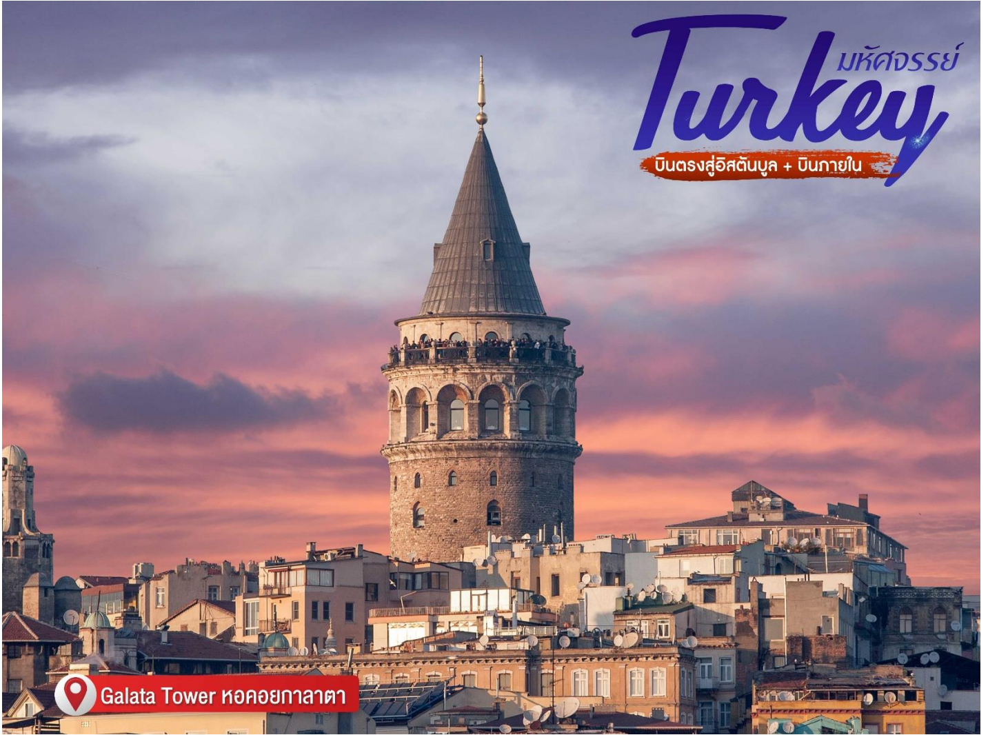
Galata Tower หอคอยกาลาตา

จุดชมวิวยุคกลางของอิสตันบูล ให้คุณมองเห็นย่านประวัติศาสตร์ของเมือง และพื่นน้ำบริเวณปากอ่าวโกลเด้นฮอร์นได้ แบบพาโนรามา (360 องศา) ในสมัยที่สร้าง หอคอยหิน GALATA นี้เป็น สถาปัตยกรรมที่สูงที่สุดในอิสตันบูล ด้วยความสูงเท่ากันร่วม 220 ฟุต (67 เมตร)