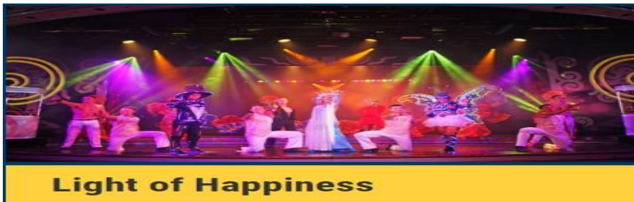
Light of Happiness

10.00 น. เรือเทียบท่าที่ เกาะอิซิกากิ หมู่เกาะโอกินาวา ของประเทศญี่ปุ่น เกาะ อิซิกากิ เป็น เกาะที่ใหญ่เป็นอันดับ 3 ของเกาะโอกินาวาซึ่งมีจุดเด่นที่น่าสนใจ มากมาย เกาะมี หลายจุดที่มีทิวทัศน์ที่สวยงามเช่นประการการประการ Hirakubozaki ซึ่งคุณ สามารถเพลิดเพลินกับทิวทัศน์ของอ่าว อ่าวคาบิระ ซึ่งได้รับการ คัดเลือกให้เป็นหนึ่งใน 100 ทิวทัศน์ของญี่ปุ่นตลอดจนมหาสมุทรแปซิฟิกและ ทะเลจีนตะวันออก มีเขตเมืองที่เต็มไปด้วยชีวิตชีวา เช่น ตลาดที่มีร้านอาหาร ทศนียภาพอันงดงามของธรรมชาติรวมถึงอ่าว อ่าวคาบิระ ซึ่งได้รับการยอมรับ ว่าเป็นจุดชมวิวที่ดีที่สุดของรัฐบาลแห่งชาติและ หอดูดาว Tamatorizaki ด้วย ดอกไม้ไม้ดอกชบา ถนนรอบเกาะช่วยให้คุณขับรถไปรอบ ๆ ขณะที่คุณเพลิดเพลิน ไปกับทศนียภาพอันงดงามของทะเลดังนั้นเราจึงขอแนะนำให้คุณเช่าหรือรถแท็กซี่ เพื่อไปเที่ยวชมจุดชมวิวที่สวยงามทั้งหมด เกาะอิซิกากิเป็นศูนย์กลางของภูมิภาค ยาเอยามะ ค้นพบเกาะต่างๆของ ยาเอยามะ ใน เกาะอิซิกากิ ท่านสามารถซื้อทัวร์ เสริมบนฝั่ง เพื่อท่องเที่ยวชมวิถีชีวิตของท้องถิ่น และไปท่องเที่ยวตามสถานที่ ที่ท่องเที่ยวได้ และกลับมาถึงเรือก่อนอย่างน้อย 1 ชั่วโมง สำหรับท่านที่ไม่ลงฝั่ง สามารถพักผ่อนกับกิจกรรมต่างๆบนเรือสำราญได้ตามปกติ