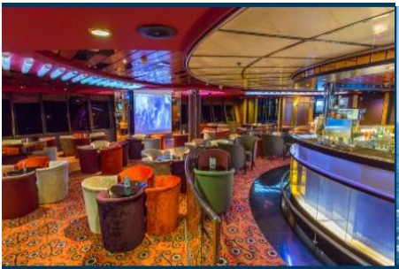
Karaoke Lounge / KTV