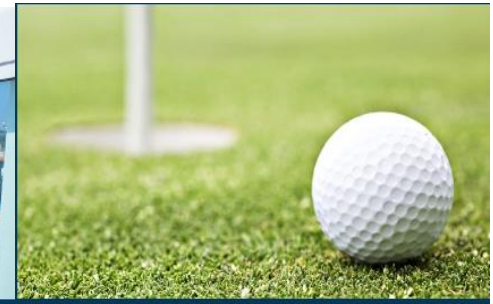
Golf Driving Range