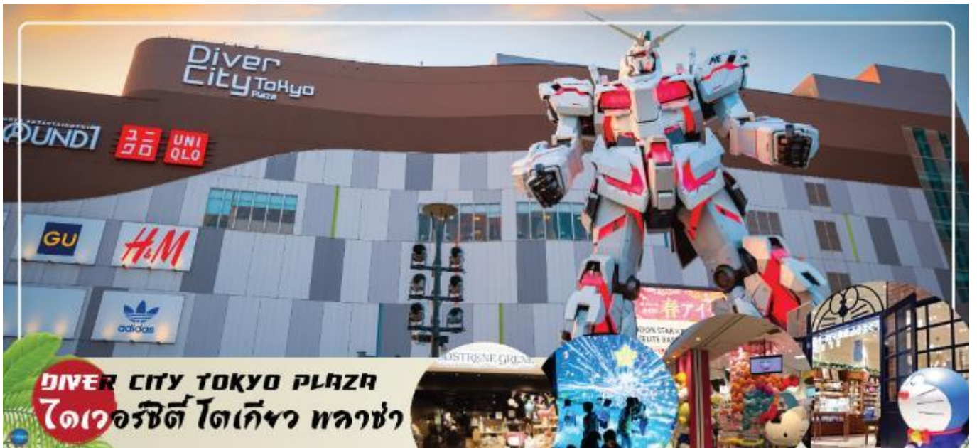
เย็น อีสระช้อปปิ้งอาหารเย็นตามอัธยาศัย

จากนั้นเดินทางสู่ ย่านโอไดบะ (Odaiba) (ใช้เวลาเดินทางโดยประมาณ 30 นาที) เมืองคือเกาะที่สร้างขึ้นไว้เป็นแหล่งช้อปปิ้ง และแหล่งบันเทิงต่างๆ ในอ่าวโตเกียว ได้รับการปรับปรุงให้มีชื่อเสียงและเป็นที่ยอมรับในช่วงหลังของปี 1990 นอกจากนี้มีสถาปัตยกรรมที่สวยงามตั้งอยู่มากมายแล้ว แต่ก็ยังคงความเป็นธรรมชาติไว้ด้วยความอุดมสมบูรณ์ของพื้นที่สีเขียว ไดเวอร์ซิตี โตเกียว พลาซ่า (Diver City Tokyo Plaza) เป็นห้างดังอีกห้างหนึ่ง ที่อยู่บนเกาะ โอไดบะ จุดเด่นของห้างนี้ก็คือ หุ่นยนต์กันดั้ม ขนาดเท่าของจริง ซึ่งมีขนาดใหญ่มาก ในบริเวณห้าง อีสระช้อปปิ้งตามอัธยาศัย